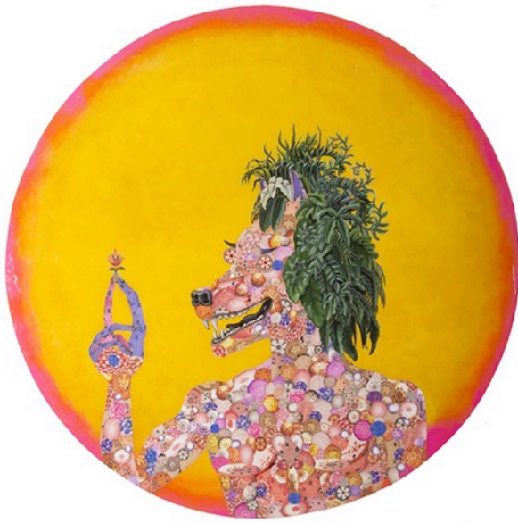
Soucouyan n°3 Technique mixte sur contreplaqué Diamètre 241 cm 2017