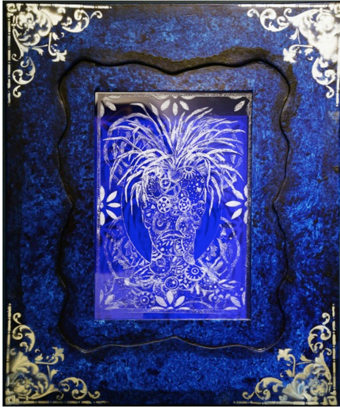
Métamorphose n°2 série Le Royaume de ce monde Gravue sur plexiglass 79 x 69 cm 2017