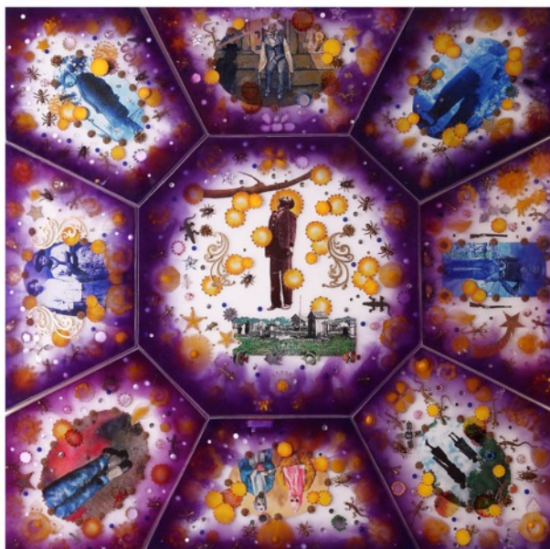
Memory Window n°9 Technique mixte 147 x 147 cm 2017