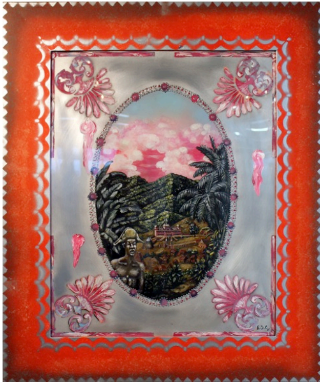
Ti Noël à Sans-Souci Technique mixte sur aluminium 99 x 84 cm 2018