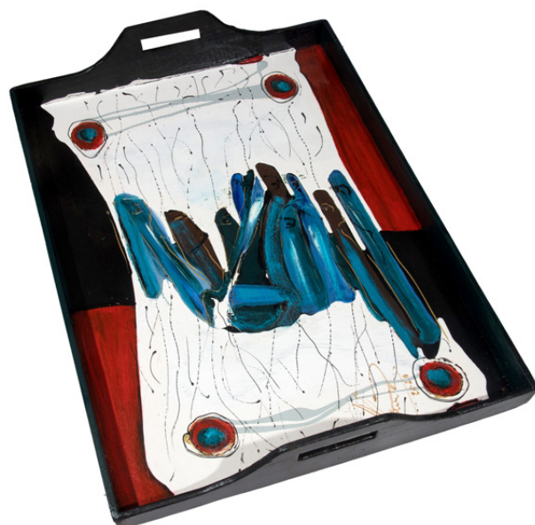
Mounia Grand Breakfast Café , 2020 Huile sur bois 75 x 56 cm

Cernées, les couleurs éclatent, jouent à la mosaïque, à la dispersion des formes en de savants entrelacs, à la fusion dans un halo. La façon de peindre varie : drue comme un grain tropical, sage dans ses aplats... les toiles sont épurées ou revendiquent l'excès, les mélanges de matières et de signes.