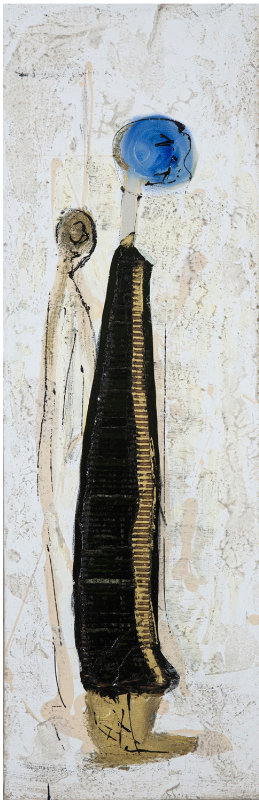
Mounia Totem 2 , 2020 Huile sur toile 90 x 30 cm © Photo Gérard Germain