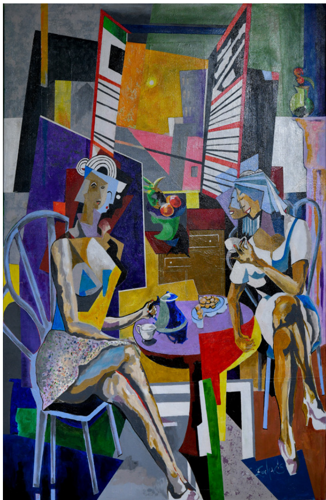
Fred Eucharis La conversation , 2019 Acrylique sur toile 92 x 65 cm