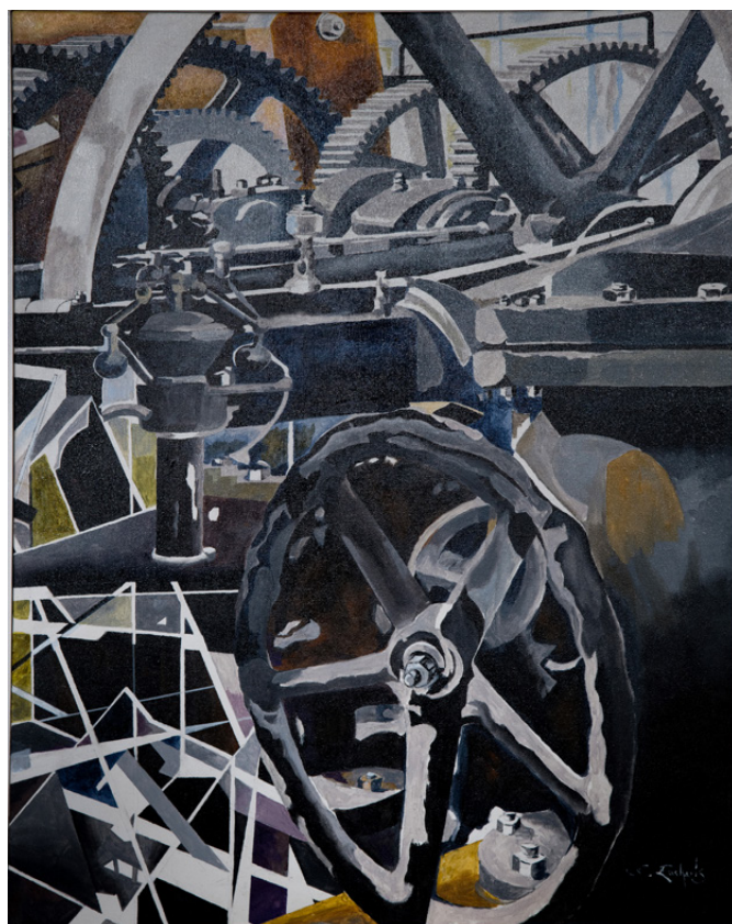
Fred Eucharis Le silence des sucreries (détail) , triptyque, 2020 Acrylique sur toile 92 x 222 cm